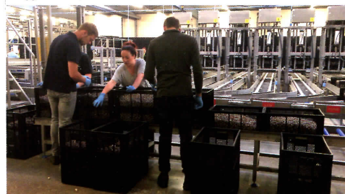
Ondanks het vele ijzer in een stal hebben de zendermicrofoons daar geen last van. Alles komt haarscherp door. (© KRO-NCRV)