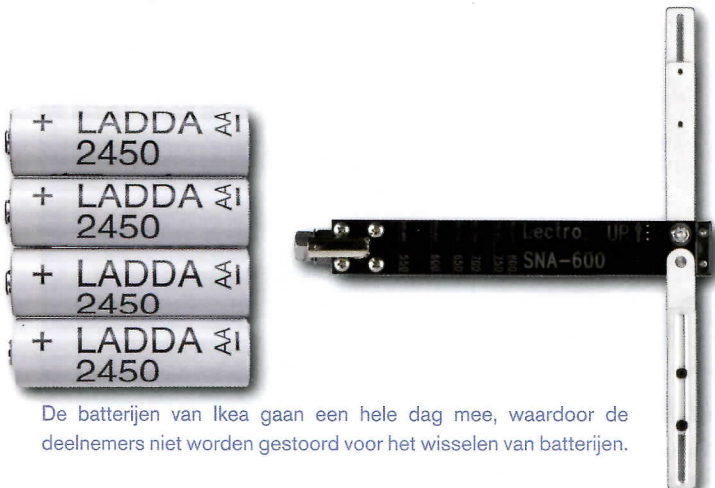
De batterijen van Ikea gaan een hele dag mee, waardoor de deelnemers niet worden gestoord voor het wisselen van batterijen.

Armando: "Om goed te kunnen nabewerken, nemen we al het geluid zo droog mogelijk op. We stellen geen filters of limiters op de microfoons en zenders in, we nemen het hele frequentiegebied op, zodat al het geluid 'raw' wordt opgenomen. Toch willen we dat het geluid in een stal ook als 'in een stal' klinkt. En ook in een veld moet het geluid bij de kijker een veldgevoel oproepen. Dat bereiken we door met een aparte microfoon het ruimtelijke (stereobeeld) geluid van de ruimte op te nemen. We noemen dat de side-microfoon, waarvoor we de Schoeps CCM 8 gebruiken. Deze heeft een figuur-8-karakteristiek die daar perfect voor is. In de nabewerking van het geluid mixen we dat ruimtelijke geluid bij het droge spraakgeluid van de zendermicrofoons. Ook het geluid van de hengelmicrofoon wordt gebruikt. Het resultaat van de mix is het geluid van een boer die in het veld staat, of in een stal. Omdat het side-geluid