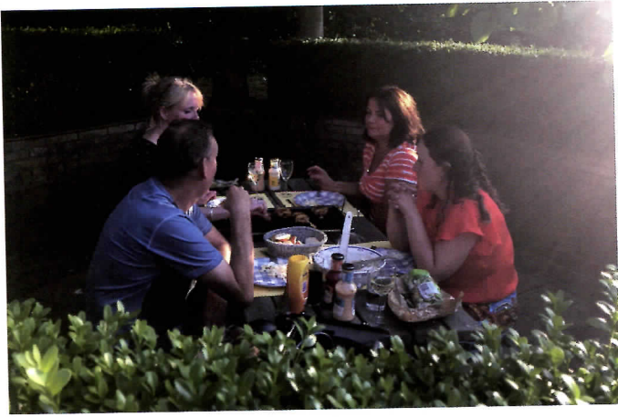
Geluidsniveaus verschillen enorm. Bij een lunch spreekt men veel zachter dan in een weiland.