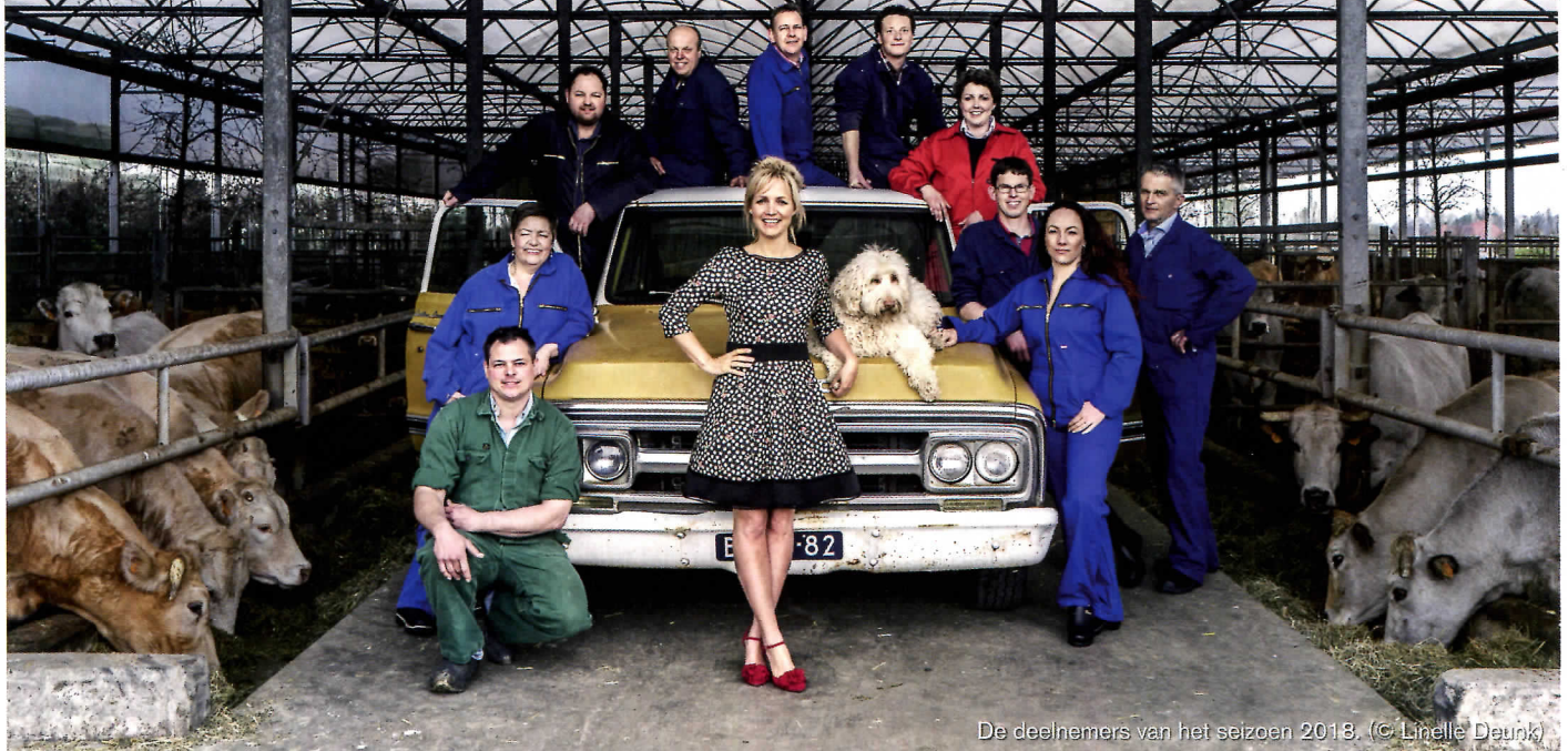
De deelnemers van het seizoen 2018.

Het geluid bepaalt voor een groot deel de sfeer van het populaire programma 'Boer zoekt Vrouw'. Hoe vinden die geluidsopnamen plaats en wat gebeurt er in de nabewerking? Pieter Reintjes sprak met de 1 e geluidsman en de regisseur.