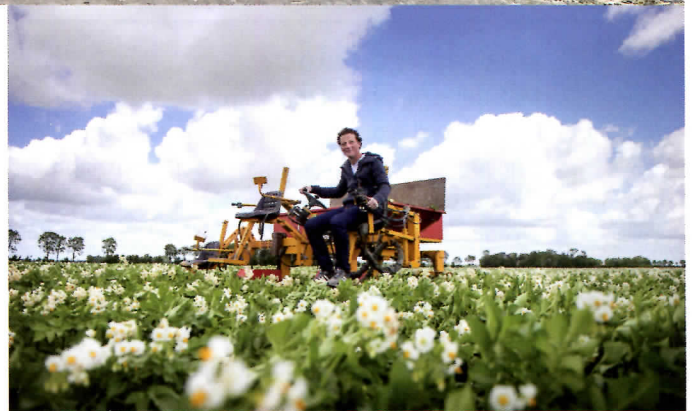
Boer zoekt Vrouw is een kijkcijferkanon!