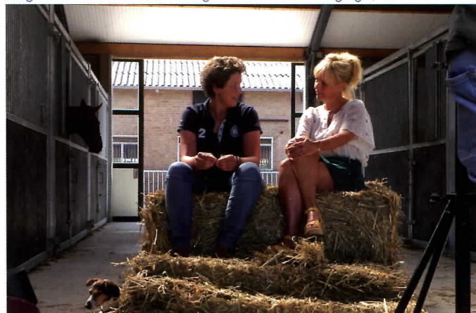
Gesprekken met Yvon Jaspers worden heel droog opgenomen en er worden geen ruimtelijke geluiden gebruikt die afleiden, zodat de kijker heel dicht bij de mensen blijft.