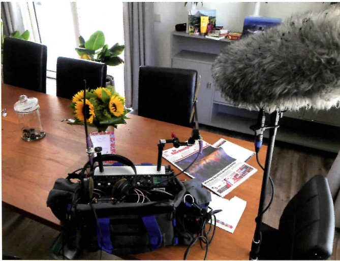
Alles bij elkaar, inclusief de recorder en de ontvanger met de antenne van Lectrosonics.

Alle kanalen worden voor de montage netjes in de tijdlijn geïmporteerd en lopen dankzij tijdcodegeneratoren exact synchroon met het beeld. De hengelmicrofoon en de side-microfoon zijn van Schoeps; de CCM 41 (of CMIT 5U) en de CCM 8.