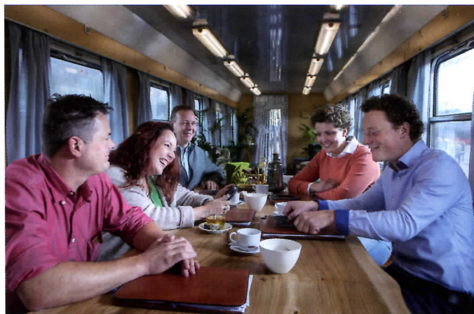
Vooraf opnamen in bijvoorbeeld de treinwagons brachten extra voorbereidingen met zich mee. Voor het geluid een hele uitdaging.

"Muziek bepaalt een groot deel van de sfeer, maar ik vind dat muziek in het programma ondersteunend moet zijn en niet een sfeer of gevoel mag opleggen. Ik kan met de muziek veel losser omgaan bij de autocross dan bijvoorbeeld bij een intieme scène. Bij snelle actiescènes past snelle muziek, maar ook dan moet